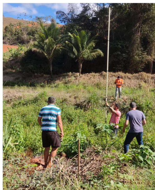
Figura 01 – estaqueamento

Aquisição de materiais de construção com a finalidade de proteger, conservar e recuperar os ecossistemas aquáticos, com o intuito principal de recuperar nascentes, conforme ocorreu nas comunidades de São Dalmácio e Comunidade de Santa Luzia.