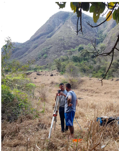
Figura 02 – Levantamento de Campo do perfil do barramento