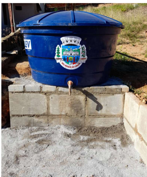
Figura 04 – Caixa d'água instalada na Comunidade de Santa Luzia – Bica