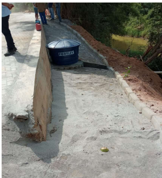
Figura 03 – Caixa d'água instalada em São Dálmacio – Bica